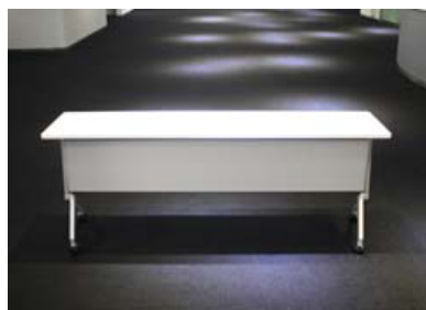
長テーブル [70 台] W1800×D450×H720