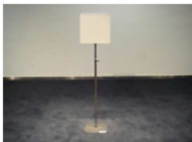
サインスタンド [5 台] H300~1250 板面 W300×H300