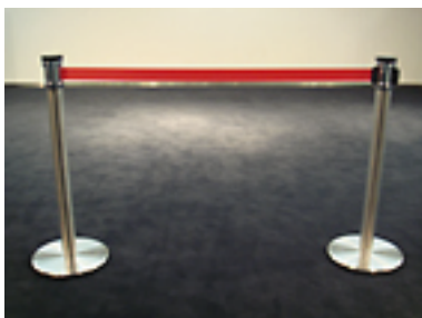
ベルトインパーティション[10 台] H700 ベルト：W2500 まで