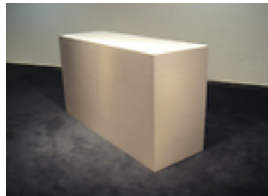
受付カウンター [2 台] W1800×D600×H1000