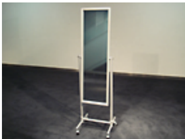
姿見 [2 台] W400×H1500