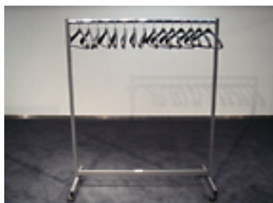
ハンガーラック [5 台] W1260×D510×H1570