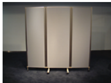
パネルパーティション [12台] W1800×D25×H1800