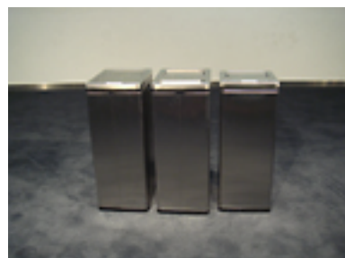
ゴミ箱 可燃用・不燃用 [4 台] W240×D330×H600 ビン・カン・ペットボトル用 [4 台] W240×D240×H600