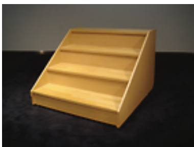
ステップ [2 台] W1000×D1000×H730

※数量は、破損・紛失により不足している場合があります。事前に必要数を担当スタッフにご確認ください。 ※使用後はきれいにさせていただいた後、現状復帰をお願いいたします。