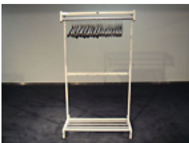
ハンガーラック [6 台] W900×D480×H1650