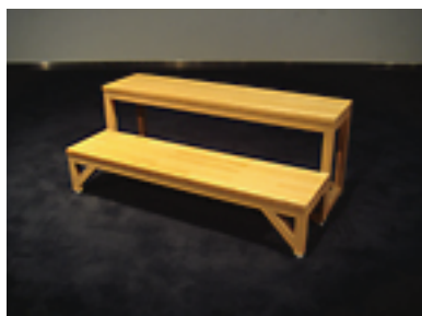
ステップ [2 台] W1000×D500×H400