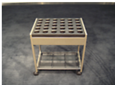
傘立て [30 本収納] W450×D320×H500