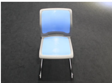
イス [270 脚] W510× D575× H775 (S415)